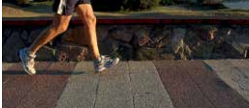
Dure looppiste of mooie landweg? p. 2