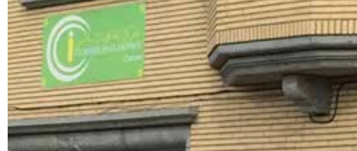
Moskee of geen moskee in Lot? p. 3