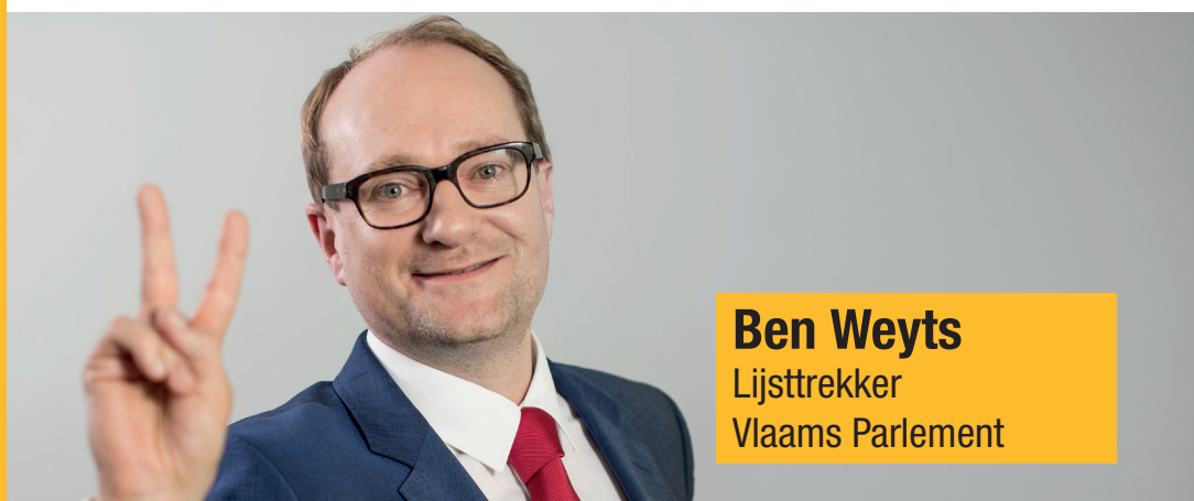
Ben Weyts Lijsttrekker Vlaams Parlement

N-VA Beersel is bijzonder fier Ben Weyts te mogen voorstellen als kandidaat bij de verkiezingen van 25 mei. Ben, parlements lid sinds 2009, trekt de N-VA-lijst voor het Vlaams Parlement.