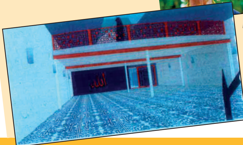
De folder bevatte ook architectplannen van het islamitisch centrum.