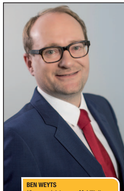
BEN WEYTS Vlaams minister voor Mobiliteit, Openbare Werken, Vlaamse Rand, Toerisme & Dierenwelzijn.

Hard werken en veel studeren. Het helpt dat ik het regeerakkoord van A tot Z mee heb onderhandeld. Ik heb ook een verleden als kabinetschef van een Vlaamse minister en ik kan terugvallen op goede medewerkers. We staan er en we zullen overeind blijven.